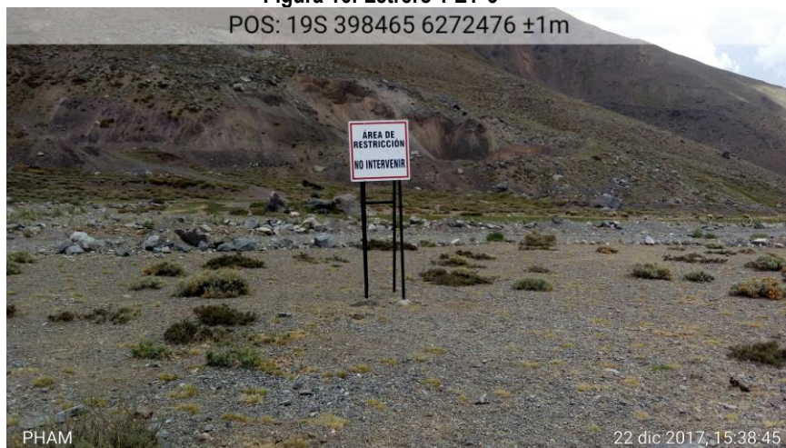
Figura 17: Letrero 2 EY-5